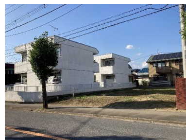
南東側より撮影現地土地