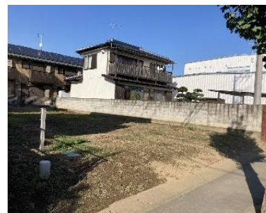
南西側より撮影現地土地