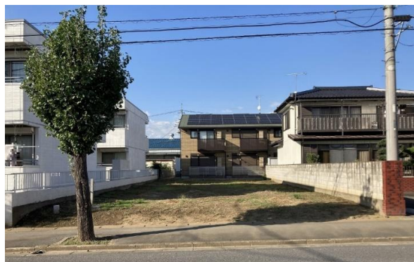
南側前面道路含む現地土地 掲載写真: 2023年10月撮影 ※街並み含む