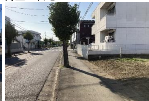
南側前面道路(東側から撮影)