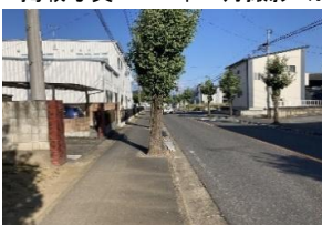
南側前面道路(西側から撮影)